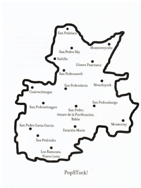
Carte de PopSTock, La Biblia vaquera , p. 12

Carlos Velázquez est un écrivain qui partage les poétiques frontalière et identitaire de Crosthwaite et qui l'accompagne souvent sur les listes d'écrivains dits du Nord confectionnées par les géographes littéraires mexicains. Il dresse une carte possible de ce monde de la culture populaire post-mondialisée, un stock, un réservoir de thèmes et d'éléments culturels manipulables, remplaçables et combinables entre eux même s'ils proviennent de rationalités étrangères : PopSTock. Dans cette carte de PopSTock, les différentes villes à l'honneur de Pedro, avec les particularités typiques des toponymes mexicains, se déclinent contre toute logique mononationale ou monolingue ; de même, La Biblia vaquera est le (sur)nom du personnage principal du livre éponyme, dont les avatars s'appellent aussi The Cowboy Bible . En fin de compte, cela n'a rien d'étonnant dans un livre qui porte comme sous-titre « Le triomphe du corrido [la chanson mexicaine par excellence] sur la logique ».